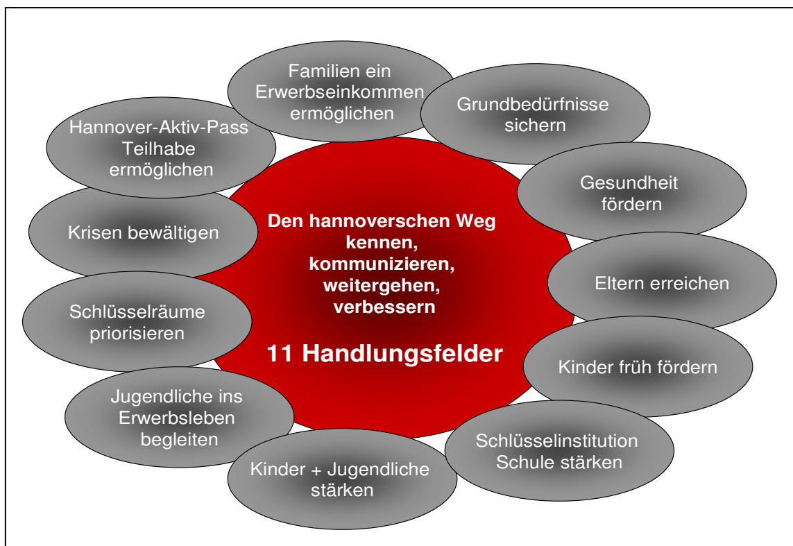
Abbildung 2: Elf Handlungsfelder

Im Mittelpunkt der elf Handlungsfelder (vgl. Abbildung 2) steht ihre Kommunikation: Hannoverschen Weg kennen, kommunizieren, weiterentwickeln.