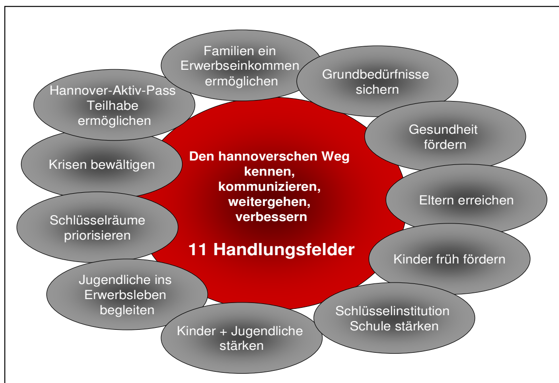
Abbildung 3: Elf Handlungsansätze