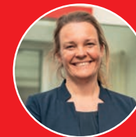
EVA BENDER ZUKÜNFTIGE SCHUL- UND BILDUNGS DEZERNENTIN