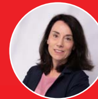
KATJA IRLE BILDUNGSJOURNALISTIN UND MODERATORIN