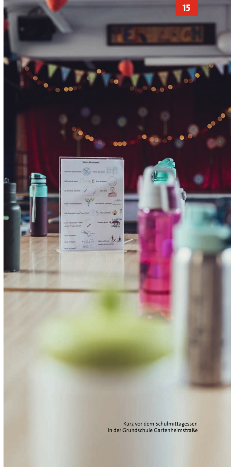
Kurz vor dem Schulmittagessen in der Grundschule Gartenheimstraße

Wir haben in dieser Ratsperiode entscheidende Schritte gesetzt, um Hannovers Schullandschaft sozial gerecht, zukunftsfähig und verlässlich weiterzuentwickeln. Mit dem Ausbau des Ganztags, dem kostenlosen Mittagessen ab 2027, der strategischen Schulentwicklungsplanung, der Stärkung der Schulbeteiligung und der neuen Hochbaugesellschaft zeigen wir: Wir als Schul- und BildungsAG stehen für eine starke, sozialdemokratische Bildungspolitik, die Kinder und Familien in den Mittelpunkt stellt.