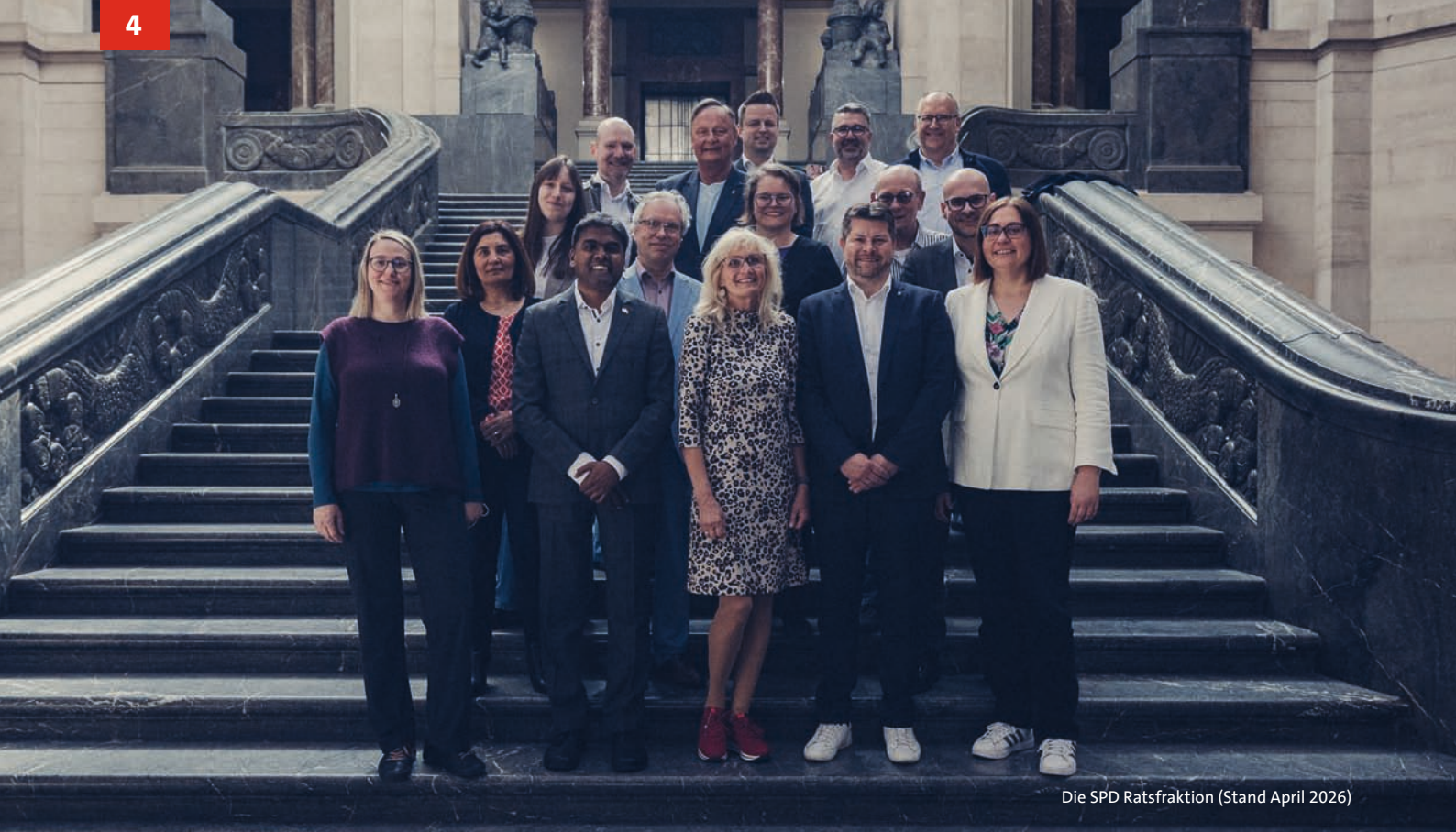
Die SPD Ratsfraktion (Stand April 2026)