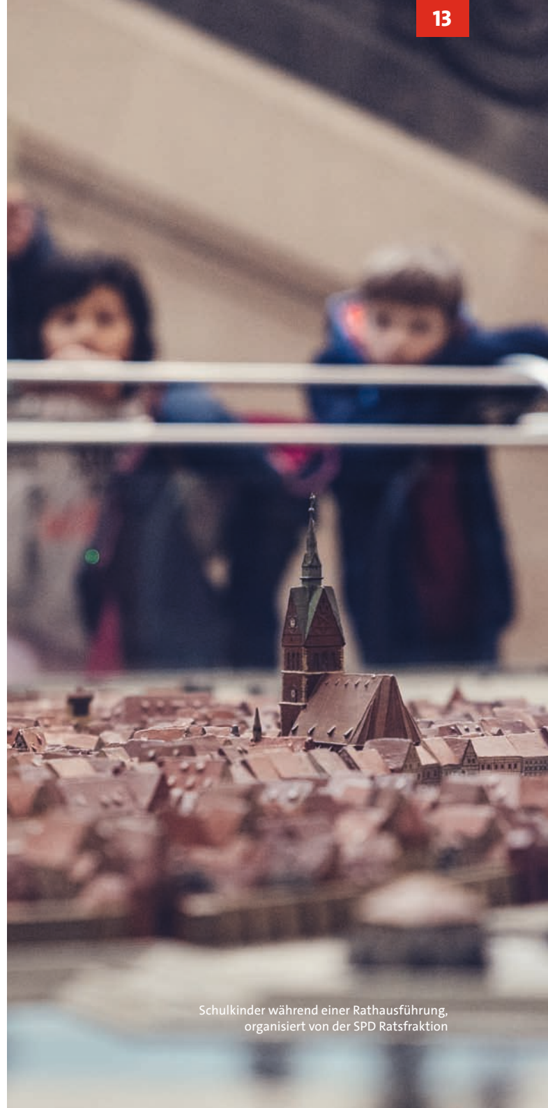
Schulkinder während einer Rathausführung, organisiert von der SPD Ratsfraktion